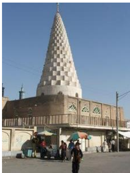
آرامگاه دانیال در شهر شوش در جنوب باختری ایران

کتاب شامل چند اشتباه تاریخی است . وجود واژه های آرامی ، پارسی و یونانی در این کتاب نشان می دهد که این کتاب در دوره های جدید تر نوشته شده است . کتاب دانیال در بخش سوم یا نوشته ها Writings جای داده شده است و نه در بخش دوم یعنی پیامبران Prophets و به این دلیل کتاب دانیال دیرتر از آن نوشته شده که در مجموعه پیامبران جای گیرد . کتاب دانیال در بردارنده برخی رویداد های تاریخی است که مدت ها پس از دانیال رخ داده اند.